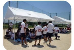
今年度からクラス毎にテントが用意されました！